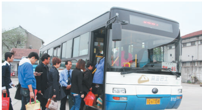
花园站常金便捷巴士沟通城乡,票价亲民,节假日客流达8000人次。