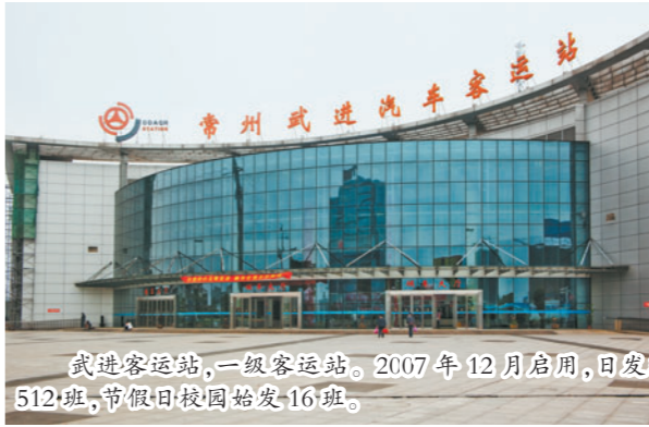
武进客运站,一级客运站。2007年12月启用,日发班次512班,节假日校园始发16班。