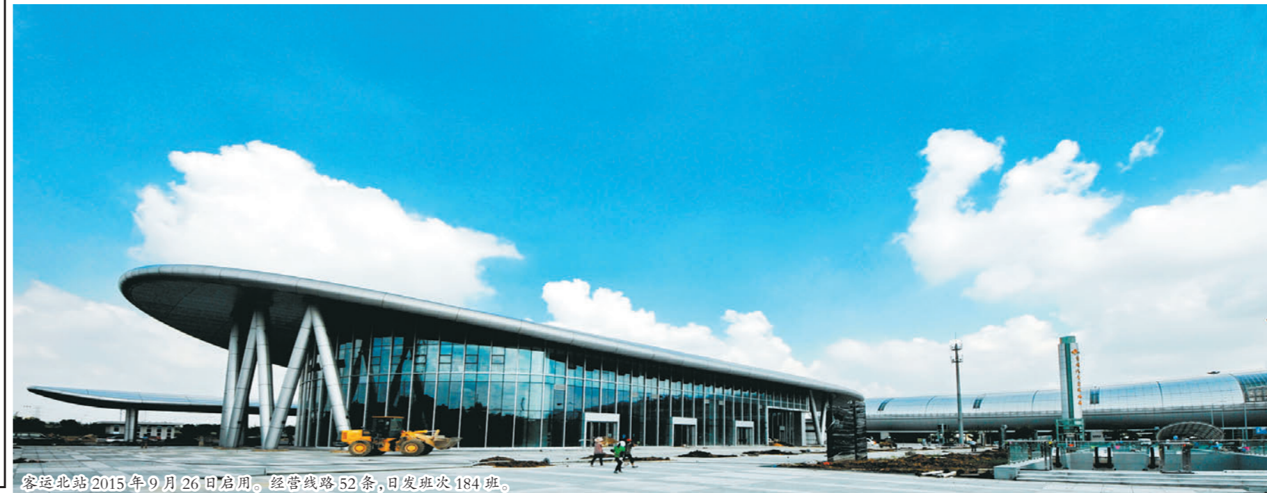
客运北站2015年9月26日启用。经营线路52条,日发班次184班。

据悉,全国的评审工作将持续到11月底,评审结果2016年3月在行业内公布。(冯炜)