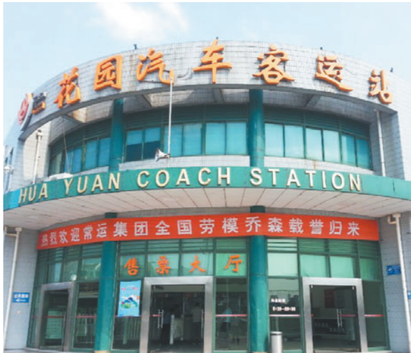
花园客运站。经营线路26条,日发班次260班。