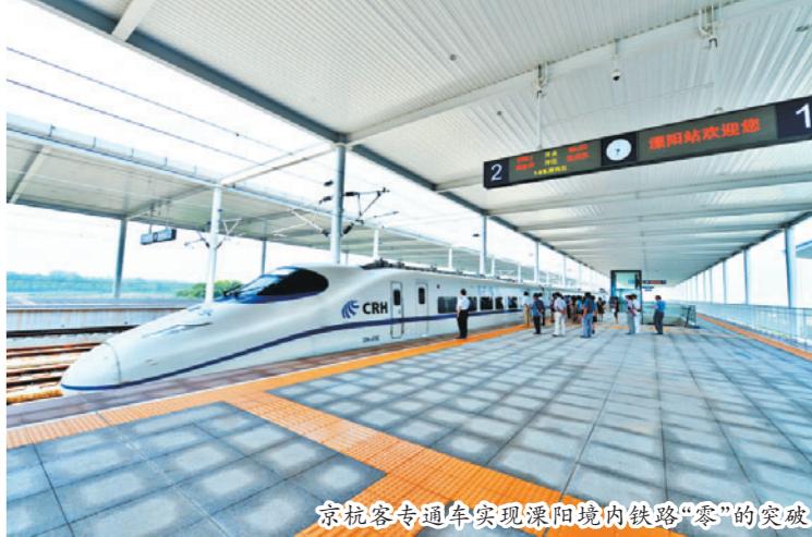
京杭客专通车实现溧阳境内铁路“零”的突破