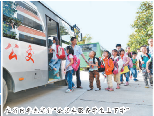
在省内率先实行“公交车服务学生上下学”