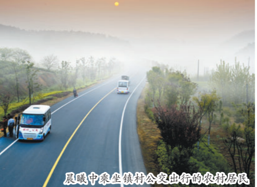
丹金溧漕河与芜申运河航道整治工程实现内河高等级航道“零”的突破