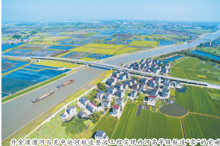
丹金溧漕河与芜申运河航道整治工程实现内河高等级航道“零”的突破