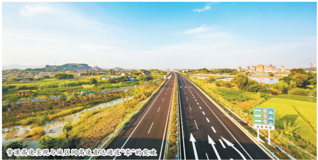
常溧高速实现与城区间高速直达通道“零”的突破