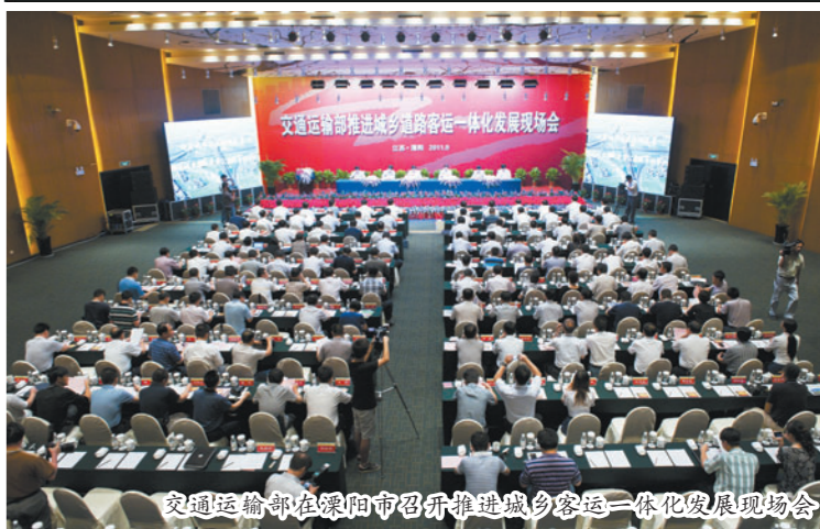
交通运输部在溧阳市召开推进城乡客运一体化发展现场会