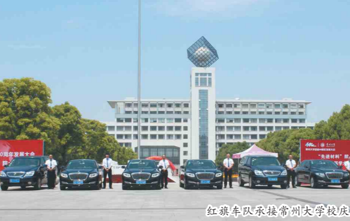
红旗车队承接常州大学校庆