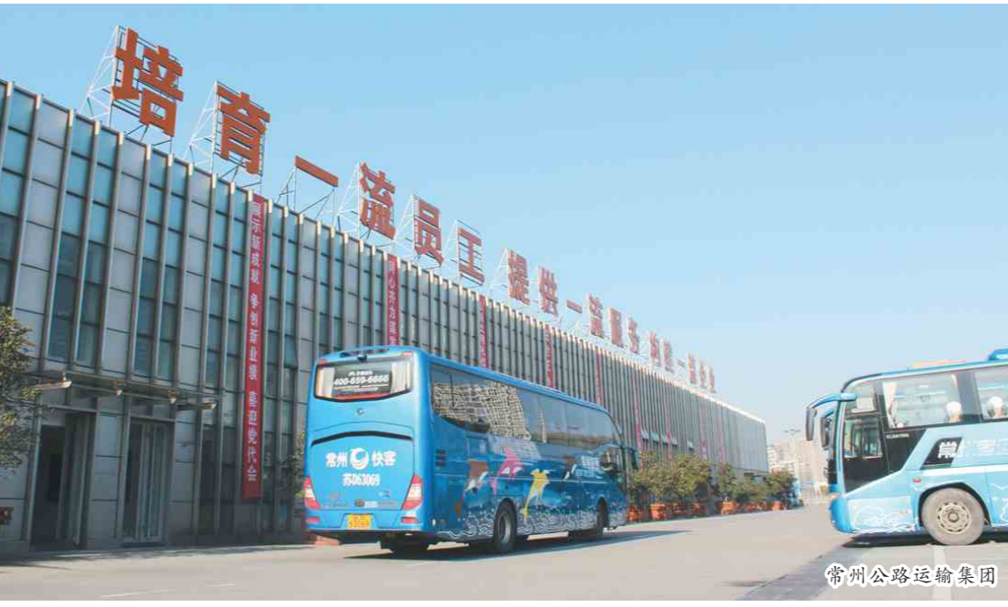
常州公路运输集团