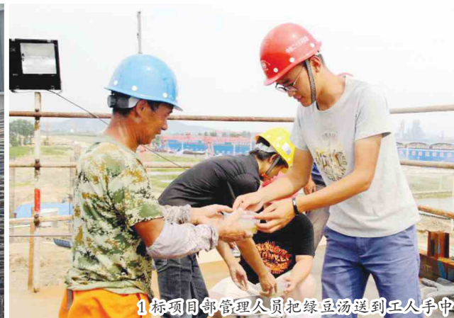
1标项目部管理人员把绿豆汤送到工人手中