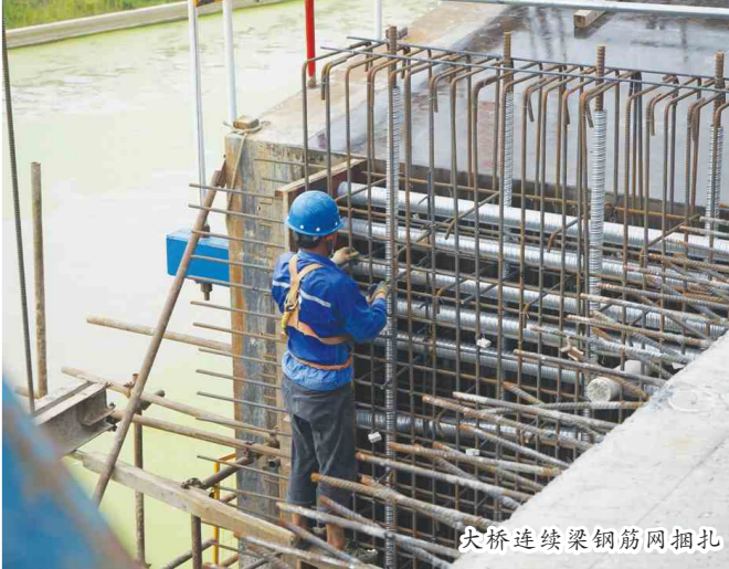
大桥连续梁钢筋网捆扎