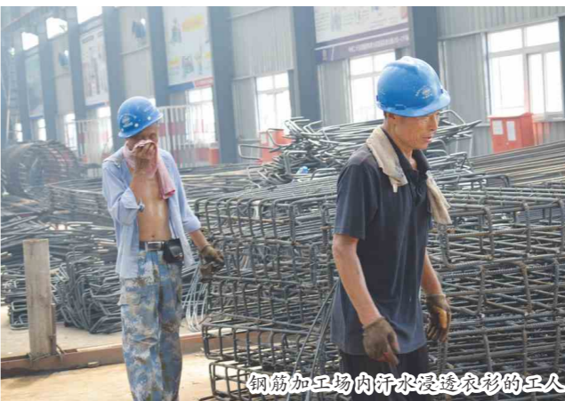
钢筋加工场内新来溧透凉衫的工人