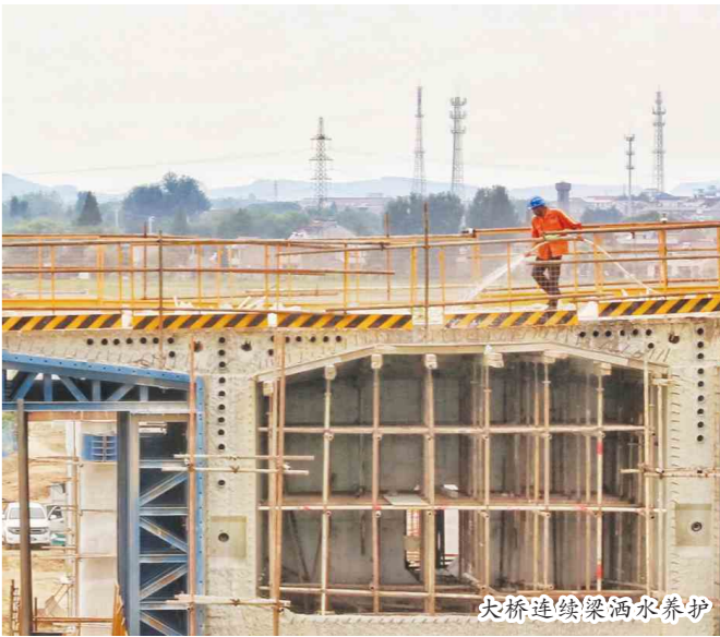
大桥连续梁洒水养护